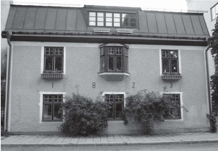
Figur 3. Kyrkogårdsgatan 13, september 2012.